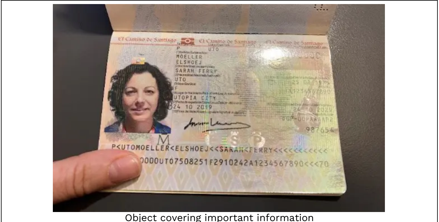
Object covering important information