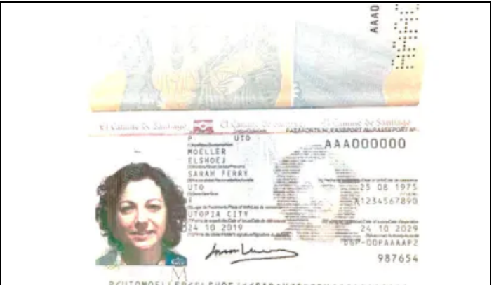
Images, which are too bright