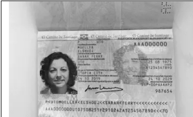
Black and white images

Digital Images which will NOT be accepted: (So nicht!)